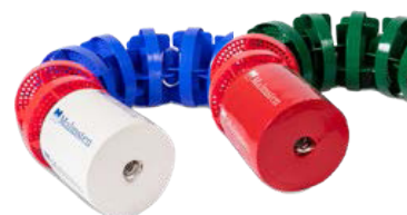
1011023 - Feszítőrugó burkolat